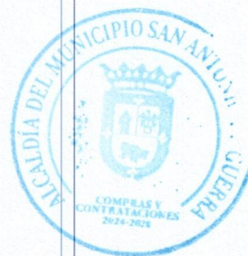
Yaseki Figuero Encargado de la UOCC